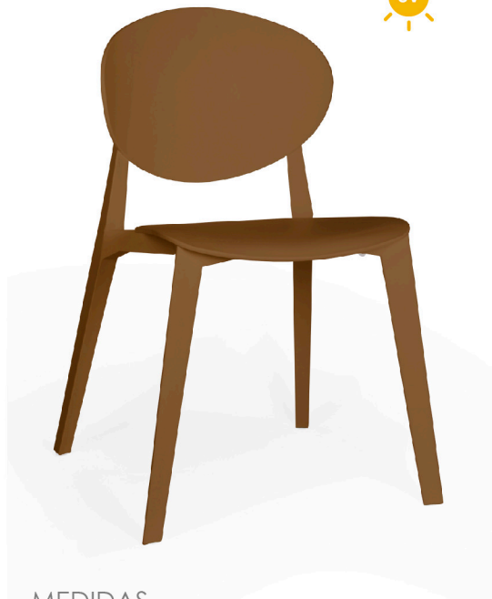
MEDIDAS Dimensiones en mm.